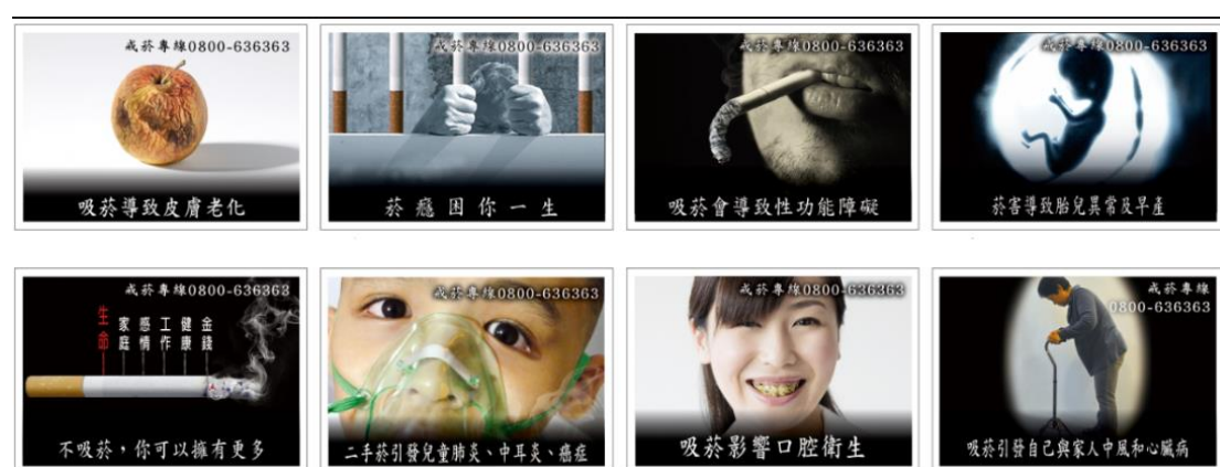
圖 5 菸盒警示圖

政府應提供人民足以辨識對其產生利弊的政策相關資訊，因此政府若要提倡健康飲食，只要普及食品健康教育，讓民眾了解過度攝取糖類的壞處，並確實標記各類商品的營養成分，便能達到一定效果；而為了減少菸品、檳榔及酒類的濫用，造成對人民健康的負面影響，政府經常在此類商品外面標註「有害身心健康」相關標誌，甚至會放上一些駭人的圖示，框架人們對於此類商品的認知(如圖 5)。輕推目的只是幫助民眾做出更好的選擇，但若民眾仍持續選擇對自身不利的方向，就表示其需求大於此選擇所需付出的成本，也可能有其餘面向的問題，如：物質成癮，此時政府就應針對此部分的人採取不同因應策略，如：醫療。